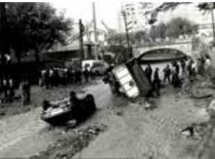
Riera de la Salut, novembre de 1983. ACBLL

Organitzen: CECBLL, ACBLL i Ajuntament de Sant Feliu