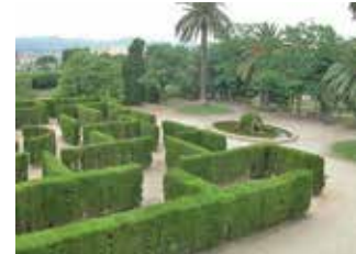
Laberint al parc de Torreblanca

Informació i inscripcions: arrellocals@gmail.com