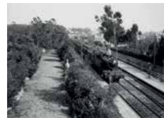
Passatge de Can Fargas. 1900-1930.