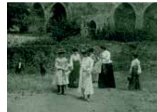
La Salut de Sant Feliu.