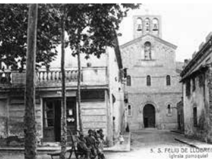
Església parroquial i plaça de la Vila 1912-1914.