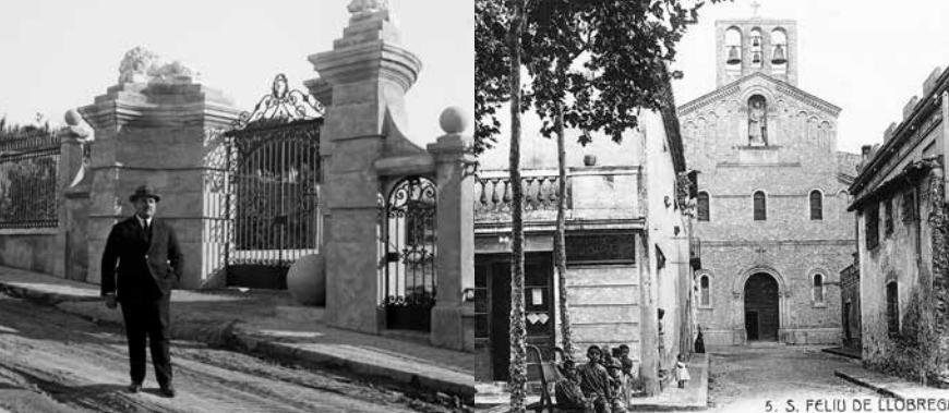
5. S. FELIU DE LLOBREGAT