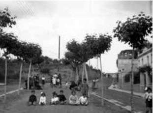
Nens i nenes davant de la "font del cuento". 1934. ACBLL