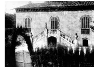
Casa de les bruixes als anys 30. ACBLL