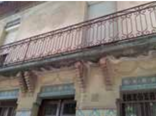
Façana de la Casa Bonaventura Raspall

La lluita veïnal que va tenir lloc als barris de Can Calders i La Salut als anys 70 constitueix un exemple dels moviments realitzats per les associacions de veïns d'aquest període a Catalunya. Coneixerem la història de la intensa lluita ciutadana que va tenir lloc en aquests dos barris a través del documental i dels mateixos protagonistes. Organitzen: Fem Barri, Associació de Veïns de la Salut, Arrels Locals.