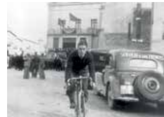
Miting polític al Casino. 1937. ACBLL