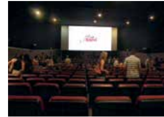
Presentació del documental de FemBarri a CineBaix