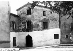
Can Panyella