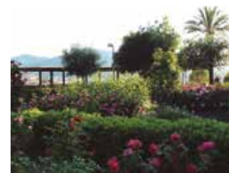
Roserar de Dot i de Camprubí.