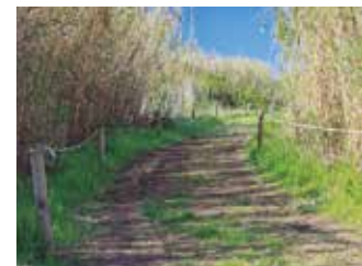
Parc Agrari del Baix Llobregat.

Donarem a conèixer les tasques que es fan dia a dia al parc amb l’objectiu de preservar i promoure els usos agrícoles, patrimonials i futurs dintre de l’entorn natural que envolta la vall baixa del Llobregat. Organitzador: Consorci del Parc Agrari del Baix Llobregat