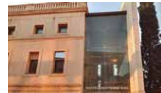
Biblioteca Montserrat Roig.

La Biblioteca Montserrat Roig s'uneix a la III Setmana del Patrimoni amb el recull bibliogràfic del patrimoni paisatgístic i arquitectònic de l'antic terme municipal de Santa Creu d'Olorda, Sant Feliu de Llobregat i el Parc natural de Collserola. Organitzador: Biblioteca Montserrat Roig