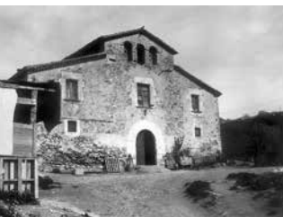
Masia de Ca n'Albareda.

Organitzador: Associació Kaleidoscopi-Sant Feliu