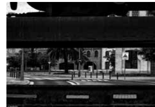
Fotografia guanyadora del concurs 2015.

Organitzadors: Creació 90, Fotògrafs de l'Ateneu i Centre d'Estudis Comarcals del Baix Llobregat