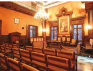
Seu del districte de Sarrià Sant Gervasi on es conserven els atributs de l'alcaldia de Santa Creu d'Olorda.