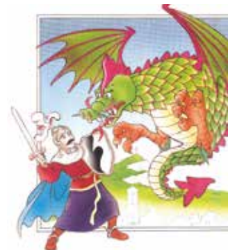
El Cavaller Guillem i el drac.

Organitzador: Colla de Geganters de Sant Feliu de Llobregat