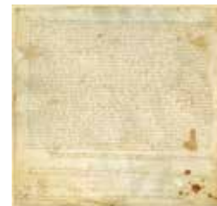
Establiment d'una peça de terra atorgada per Llorenç Noguera, del terme del castell d'Olorda, a favor de Bernat Planes, del mateix lloc. Molins de Rei. 1430, maig, 18. ACBL. Fons Planas Cuyàs. Codi 97.

Organitzador: Arxiu Comarcal del Baix Llobregat