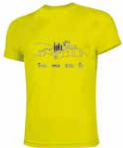
Samarreta de la XXVI Caminada.