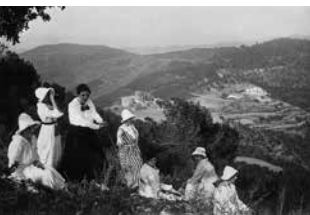
Excursió de dones santfeliuenques a Santa Creu d'Olorda.