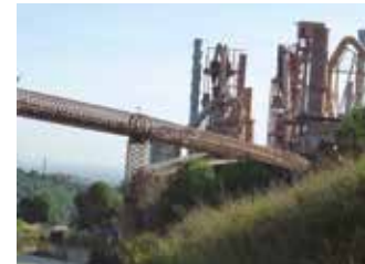
Cimentera Sànsion.

El conjunt industrial de la Sànsion planteja dubtes sobre el seu futur: aprofitament de les estructures o desaparició. En aquest acte es presentaran diferents alternatives amb la intenció d’oferir elements de judici sobre el tema. Organitzadors: USLA / Ateneu Santfeliuenc