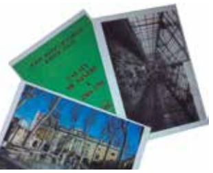
Material de les activitats educatives d'Arrels Locals.