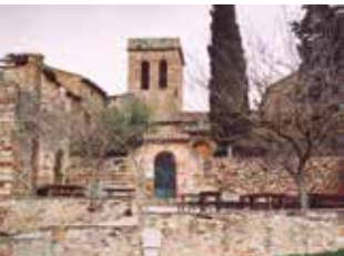
Església de Santa Creu d'Olorda i terrassa del bar. Fotògraf, Sergio Ayala Benítez. ACBL. Col·lecció d'imatges ciutadanes de Sant Feliu de Llobregat. Cedida per Sergio Ayala Benítez