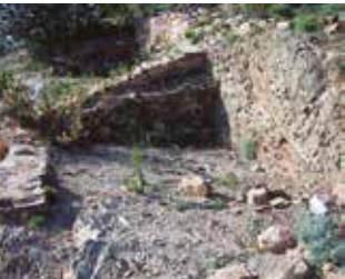
Jaciment de la Penya del Moro.

Informació i reserves: setmanapatrimonisf@gmail.com Organitzador: Arrels Locals