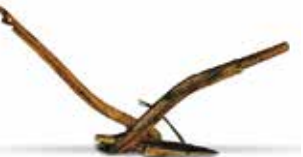
Arada catalana segle XIX. Museu de la vida rural.