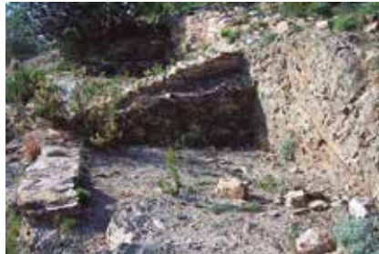
Jaciment de la Peña del Moro.

Organitza: Col·legi Mare de Déu de la Mercè