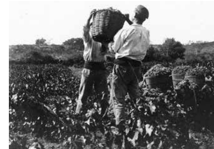
Homes carregant un cistell durant la verema.

Una exposició que pretén donar a conèixer el sector de la pagesia a partir de l'objecte, tot fent partícips els visitants de la importància del sector primari en les nostres vides. Organitza: USLA