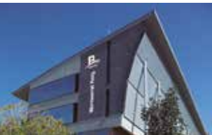
Biblioteca de Sant Feliu.