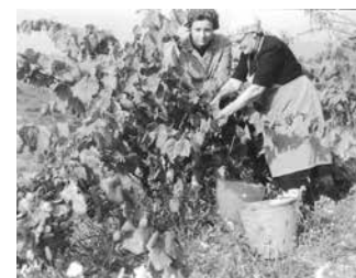
Col·lecció ciutadana d'imatges, fotògraf desconegut, 1970, ACBL.

Informació i inscripcions: setmanapatrimonisf@gmail.com Organitza: USLA