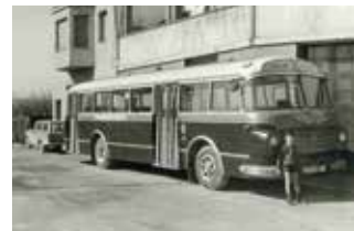
Xavier Batlle, fill del Sr. Batlle al costat del bus núm. 30.