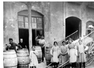
Cal Boter