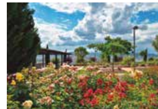
Parc del Roserar de Dot i de Camprubí.

Informació i inscripcions: setmanapatrimonisf@gmail.com Places limitades Organitza: Amics de les Roses i Kaleidoscopi